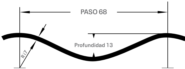
Figura 1. Dimensiones de la corruga 68 mm x 13 mm